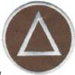
Fachdienstabzeichen SEG Betreuung

Die Schnelleinsatzgruppe-Betreuung (SEG-Bt) unterstützt die Einsatzleitung bei Großschadensereignissen/Katastrophen, insbesondere bei einem Massenansturm von Verletzten (MANV). Sie betreuen unverletzt und leicht verletzt Betroffene sowie deren Angehörige. Für Einsatzkräfte, die während des Einsatzes Stressreaktionen zeigen, steht die SEG-Bt als erster Ansprechpartner zur Verfügung, der sie an Spezialisten weiter vermittelt.