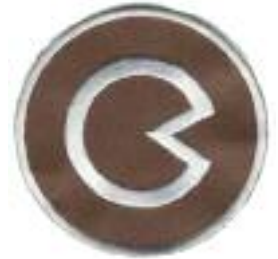
Fachdienstabzeichen SEG Verpflegung

Die Schnelleinsatzgruppe-Verpflegung (SEG-V) unterstützt die Einsatzleitung, indem sie bei Großschadensereignissen/Katastrophen die Verpflegung zubereitet und diese an hilfsbedürftige Personen und Einsatzkräfte verteilt.